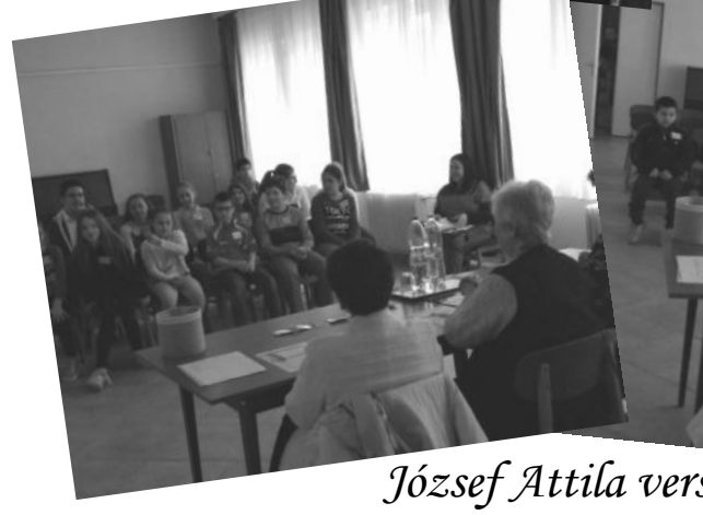
József Attila versmondó verseny