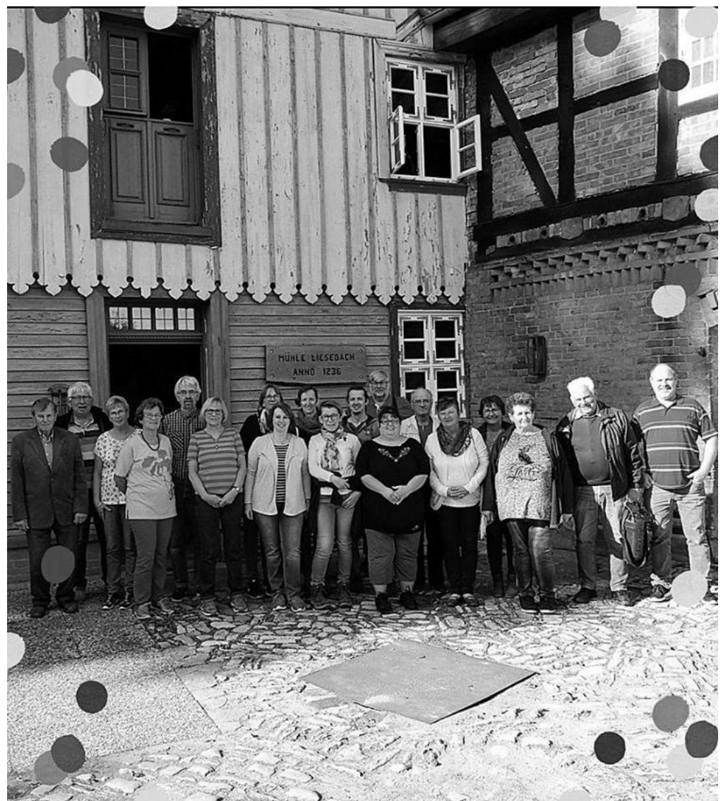
Liesebach Malom Rábke településen