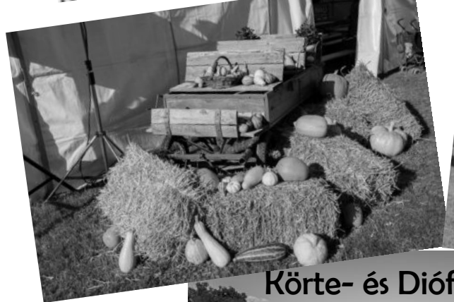
Körte- és Diófesztivál