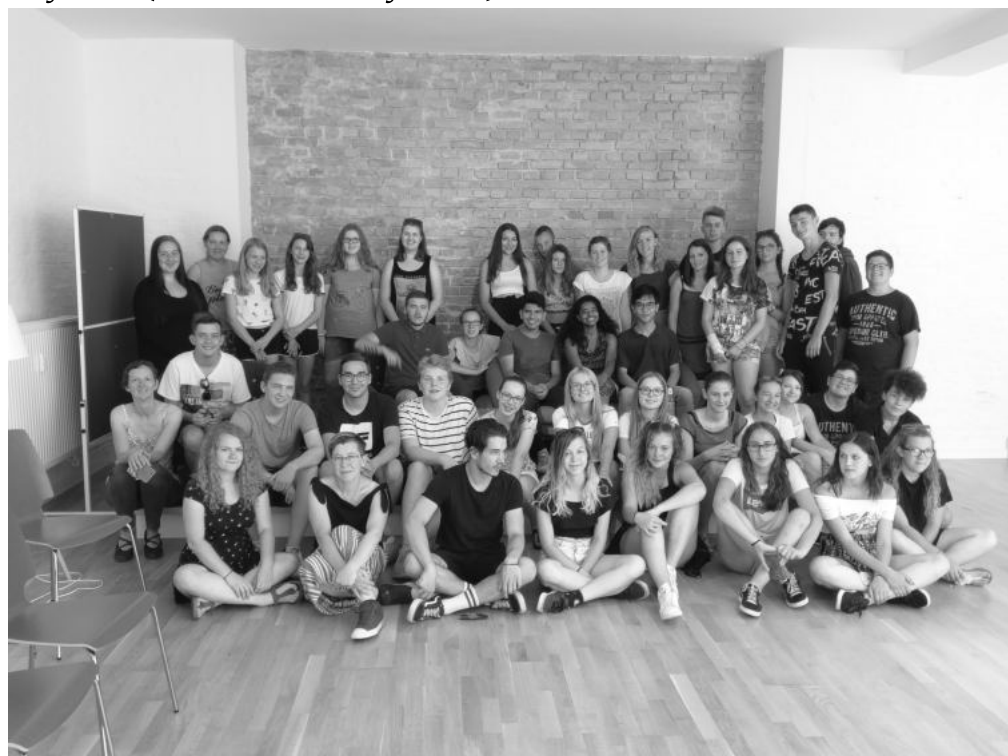
Csoportkép a berlini önkéntesekkel való találkozóról