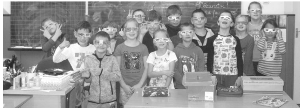
Boldog Iskola Program - optimista szemüvegben a másodikosok

Munkájukhoz további sikereket kívánunk. Ünnepi készülődések sora fonta át az októbert. A hatodik osztályosok az aradi vértanúkra való megemlékezésükkel, a nyolcadikosok nagyon mély, meghatározó október 23-i ünnepi műsorukkal, míg a 3. osztályosok az idősek napi ajándékműsorral szereztek emlékezetes pillanatokat a nézőközönségnek.