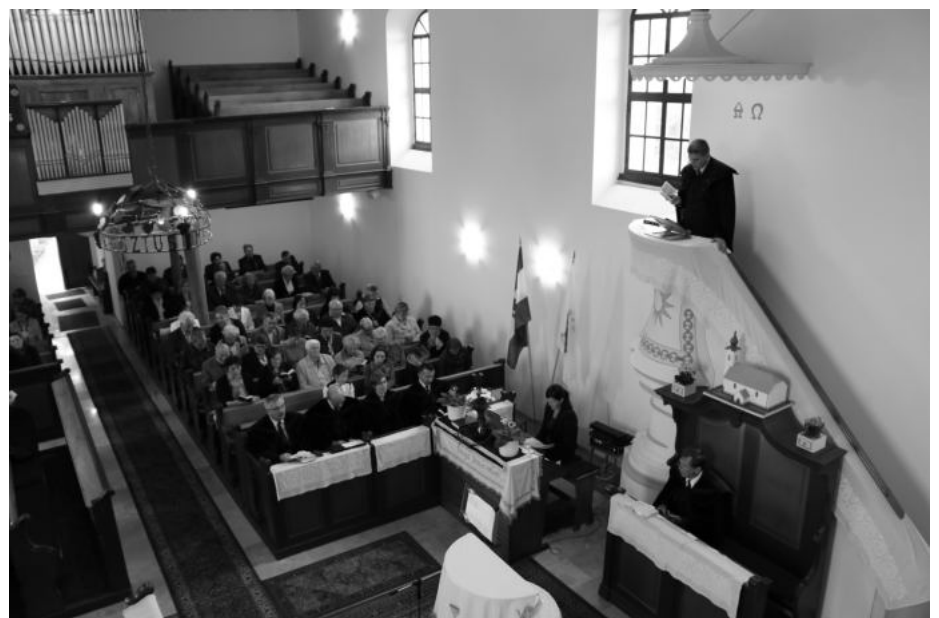
Magas Bakonyi istentisztelet a református templomban