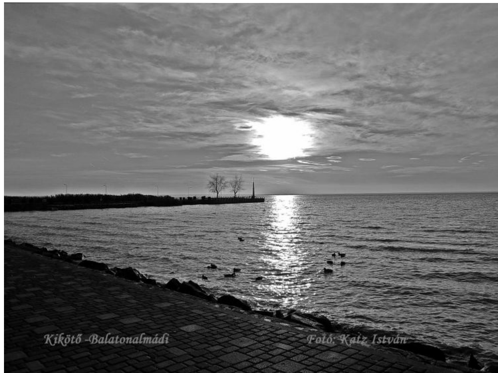
Kikötő - Balatonalmádi