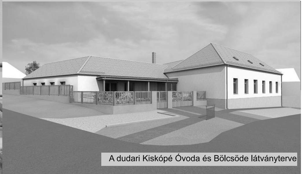
A dudari Kiskópe Óvoda és Bölcsőde látványterve

Közel 100 millió forint vissza nem térítendő támogatást nyert DUDAR TELEPÜLÉS BÖLCSŐDE KIALAKÍTÁSÁRA. Köszönetünket fejezzük ki Óvádi Péternek, a FIDESZ választókerületi elnökének folyamatos támogatásáért és segítségéért!